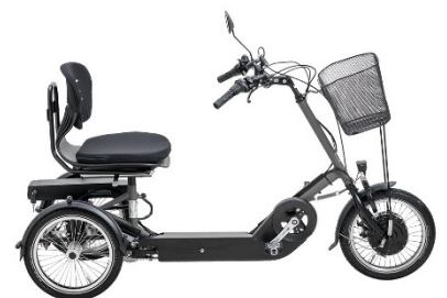
DISCO Medi P25